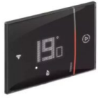
SMARTHER 2 INCASSO NERO